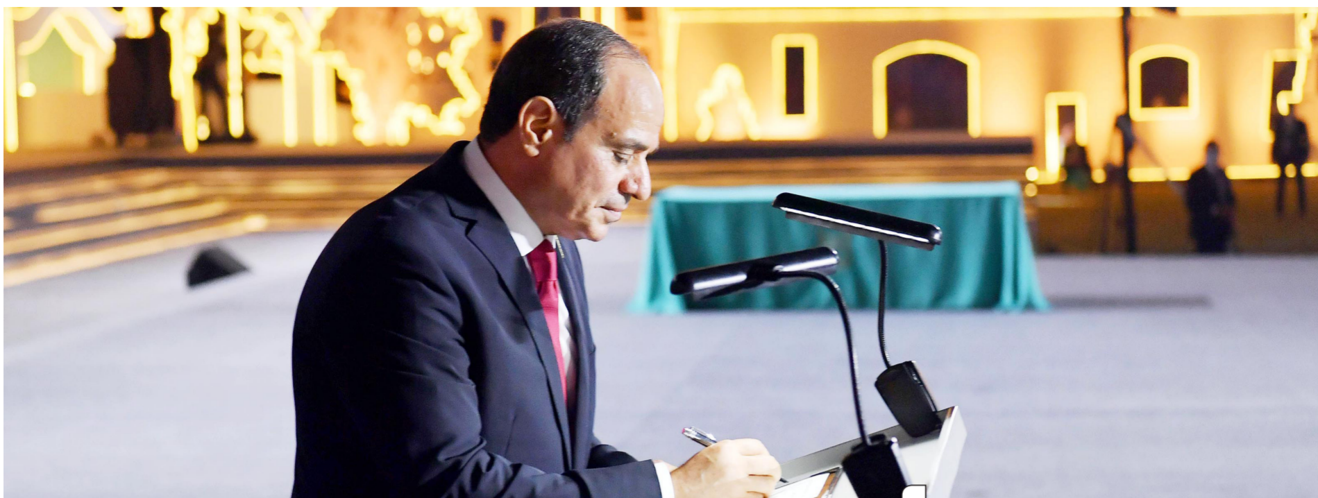
احتفالية إطلاق مشروع تنمية الريف المصرى حياة كريمة