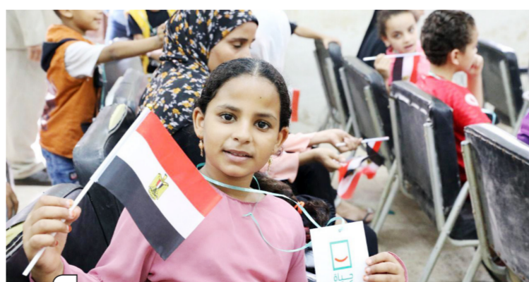
مبادرة حياة كريمة

إنشاء قاعدة بيانات لتحديد وحصر الفئات المستهدفة من أنشطته بالتكامل مع قاعدة البيانات القومية