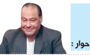
حوار: عبدالمنعم فودة

جاء دور كوكب الشرق أم كلثوم كمنقلة فاصلة في مشوار النجمة صابرين الفني حيث منحها هذا الدور نجاحاً مدوياً وشهرة كبيرة وحقق صدى عربي ودولياً وقت عرضه، وبعد تقديم هذا العمل قررت اعتزال الفن، وارتدت الحجاب وقدمت بعض البرامج الدينية.