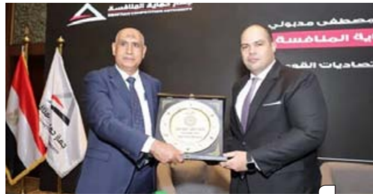
إشادة دولية بخطوات مصر لدعم سياسات المنافسة والحياد التنافسي والرقابة