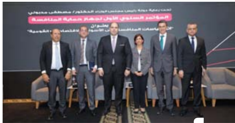
المؤتمر السنوي الاول لجهاز حماية المنافسة

قانون المنافسة المصري يخول جهاز حماية المنافسة إصدار الآراء حول التشريعات والسياسات التي قد تؤثر على المنافسة