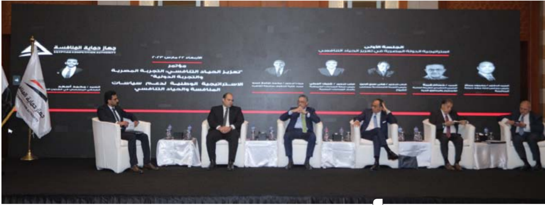
الجلسة الأولى لمؤتمر تعزيز الحياد التنافسي